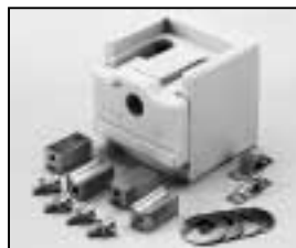
L4.73824.E Lampholder compl. Lampenfassung kpl.