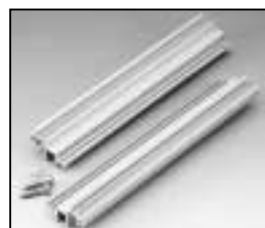
L4.82236.E Insert section left and right Einschubprofil links u. rechts