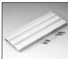
L4.82175.E Extrusion middle Rippenblech mitte