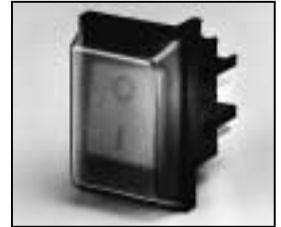
L4.72826.E On/Off switch Wippschalter