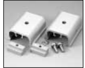
L4.82487.E Stirrup bracket Bügellager