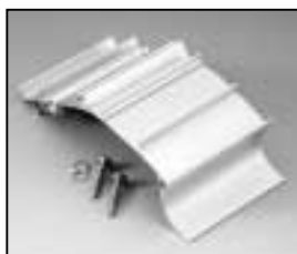
L4.82257.E Bottom extrusion right Rippenblech unten rechts