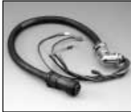
L4.82649.E Mains cable Schaltbau (German TV Standard) Scheinwerferkabel (Schaltbau Fernsehnorm)