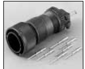
L4.71874.E Veam connector (Male) Veam Stecker (Stiftkontakt)