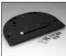
L4.82241.E Intermediate plate Zwischenplatte