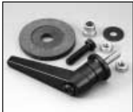
L4.82115.E Stirrup mounting-set Bügelbefestigungs-Set