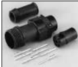
L4.75603.E Schaltbau connector (Female) Schaltbau Stecker (Buchsenkontakt)