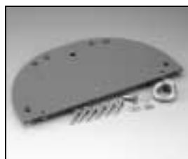
L4.82239.E Cover plate Deckplatte

NOTE: WHEN ORDERING QUOTE PART NUMBER BEMERKUNG: BEI BESTELLUNG IDENT.-NR. ANGEBEN