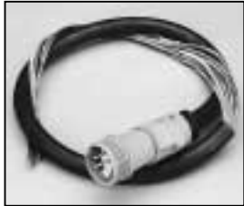
L4.82648.E Mains cable (Schaltbau) Scheinwerferkabel (Schaltbau)