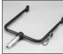
L4.82466.E Stirrup Haltebügel