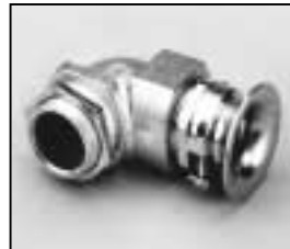
L4.73474.E Strain relief assembly Kabelverschraubung