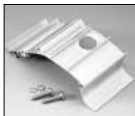
L4.82243.E Bottom extrusion left Rippenblech unten links