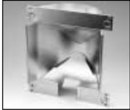
L4.82206.E Reflector Reflektor