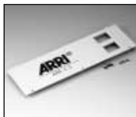
L4.82429.E Front plate Frontplatte