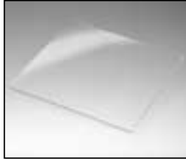
L4.82465.E UV-protective glass UV-Schutzscheibe