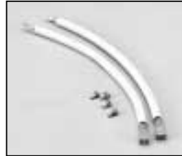
L4.78138.E H.T. cable cpl. Lampenkabel kpl.