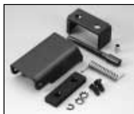
L4.82116.E Top latch compl. Torsicherung kpl.