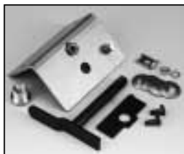
L4.82247.E Lampholder support Fassungsträger