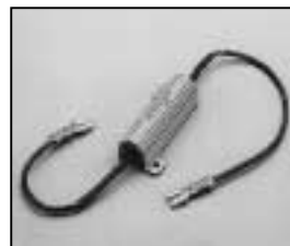
L4.73455.E Compensating resistance for electronic hour counter Vorwiderstand für elektr. Betriebs- stundenzähler