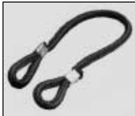
L4.79855.E Cable tie Halteleine