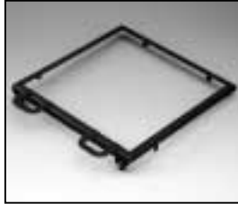
L4.82453.E Frame Rahmen