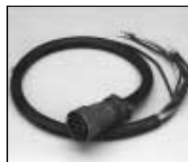
L4.82629.E Mains cable (Veam) Scheinwerferkabel (Veam)