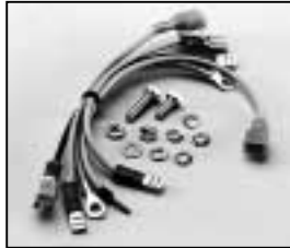
L4.82628.E Connecting wire Verbindungsleitungen