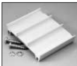
L4.82176.E Bottom extrusion middle Rippenblech unten mitte