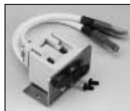
L4.82117.E Lampholder + lampholder support Lampenfassung + Fassungsträger