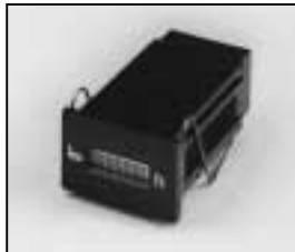
L4.77678.E Hour counter; electronic Betriebsstundenzähler elek.