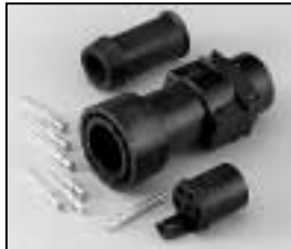
L4.75602.E Schaltbau connector (Male) Schaltbau Stecker (Stiftkontakt)