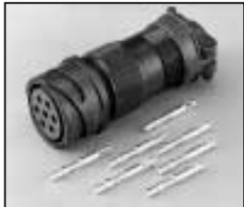
L4.71876.E Veam connector (Female) Veam Stecker (Buchsenkontakt)