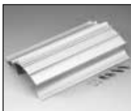
L4.82237.E Extrusion left Rippenblech links