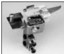
L4.82118.E Safety switch compl. Endschalter kpl.