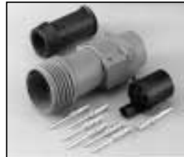
L4.75604.E Schaltbau connector with traction relief Schaltbau Stecker mit Zugentlastung