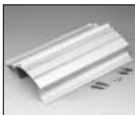
L4.82725.E Extrusion right Rippenblech rechts