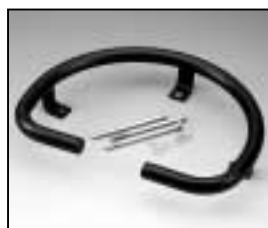
L4.82244.E Base skid Kufe